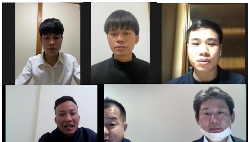
応募者全員と採用面接前に、マッチング審査を行います。

この度、厳選なる事前審査と採用面接を経て、新たに3名の特定技能外国人材を栃木県に迎え入れることとなりました。長期に定着し、受け入れ企業ならびに地域に貢献できる人材に育つよう、支援させていただきます。