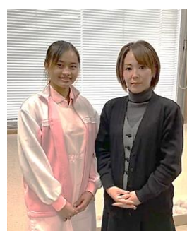
皆さん、介護福祉士の資格取得を目指して頑張っています。